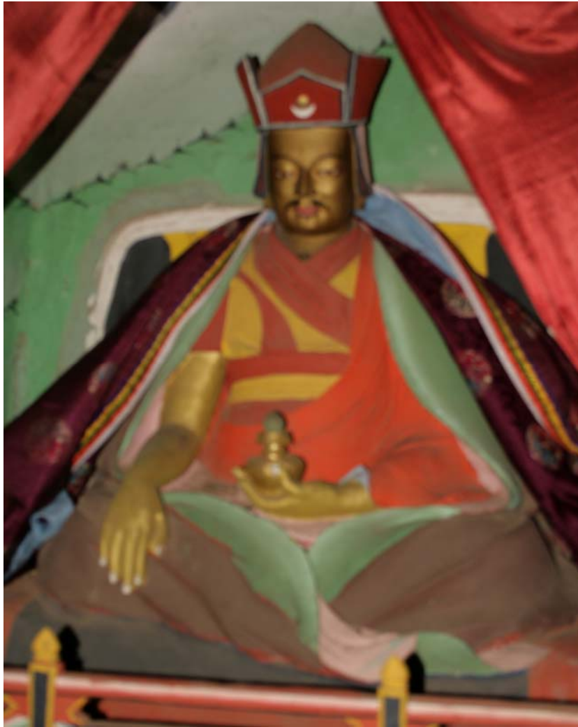
གཏེར་སྟོན་ཤེས་རབ་མེ་འབར་གྱི་སྐུ་འདྲ། (སྐུ་པར་འདི་སྐོར་སྤང་པའི་ས་ རྫོང་བླ་མ་ལང་ནང་ཡོད།)