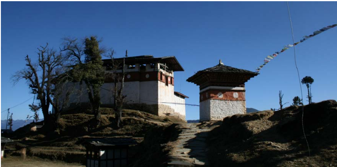
གཏེར་ཤེས་རབ་མེ་འབར་གྱི་གདན་ས་ སྤོར་སྤང་པའི་ས་ ཨོ་རྒྱན་གྱ་ཅུའི་ལྷ་ཁང་གི་པར།

གཏེར་ལ་རྩྭ་། དཀྱིལ་ཡང་མང་ཞིང་སློབ་དཔེ་ལོང་དུ་རྒྱུད་། ཚོས་དང་རང་རྒྱུད་འདྲེས་ཤིང་འཇིག་རྟེན་ཚོས་བརྒྱད་ བུལ་། ཚོས་རྣམས་ལྟ་སྲུ་ཉཅིང་རང་དོར་རྩྭ་། སེམས་དང་སེམས་འབྱུང་ཕྱི་རིག་དོར་རྩྭ་། ། ཤེས་ཀྱན་གྲོལ་འཇིག་ རྟེན་ཚོས་རྣམས་རྩྭ་། དཀྱིལ་མེད་ཐག་ཚོད་དབྱིངས་ཉུ་དེ་དུ་རྩྭ་། ཡིན་མེན་ཐ་སྐད་ཐོམ་སློང་ཡུལ་རྩྭ་། སྐྱ་ན་བསམ་ བརྗོད་ཐལ་བའི་རང་ཉིད་ལས་། རིག་པ་རྟེན་མེད་དབྱིངས་སུ་སྤྱད་རྒྱ་ཉོ་། ཨ་ཨི་ཨེ་། ས་མ་ཡ་རྩ་ཐིམ་། ཨེ་མ་ར་ ལ་མོས་ཤི་གཉེ་སྟེ་རྒྱུད་འཛིན་པ་རྣམས་དང་། བྱ་དང་བྱ་ཚེན་ཁྲི་ཞུས་སློབ་མ་དང་། རང་བྱད་རང་གིས་མ་མཐོང་བྱ་ སྤྱད་དང་། རང་ཕྱིད་རང་གིས་མན་མཐོང་བྱ་སྤྱད་དང་། མར་གྲིས་མར་སྟོད་ཀ་མ་མཐུལ་ཡོན་ཆ་དང་། ཕྱོགས་བཅུ་ དུས་..... (རྣམ་ཐར་དེའི་མཚུགས་ཐོབ)