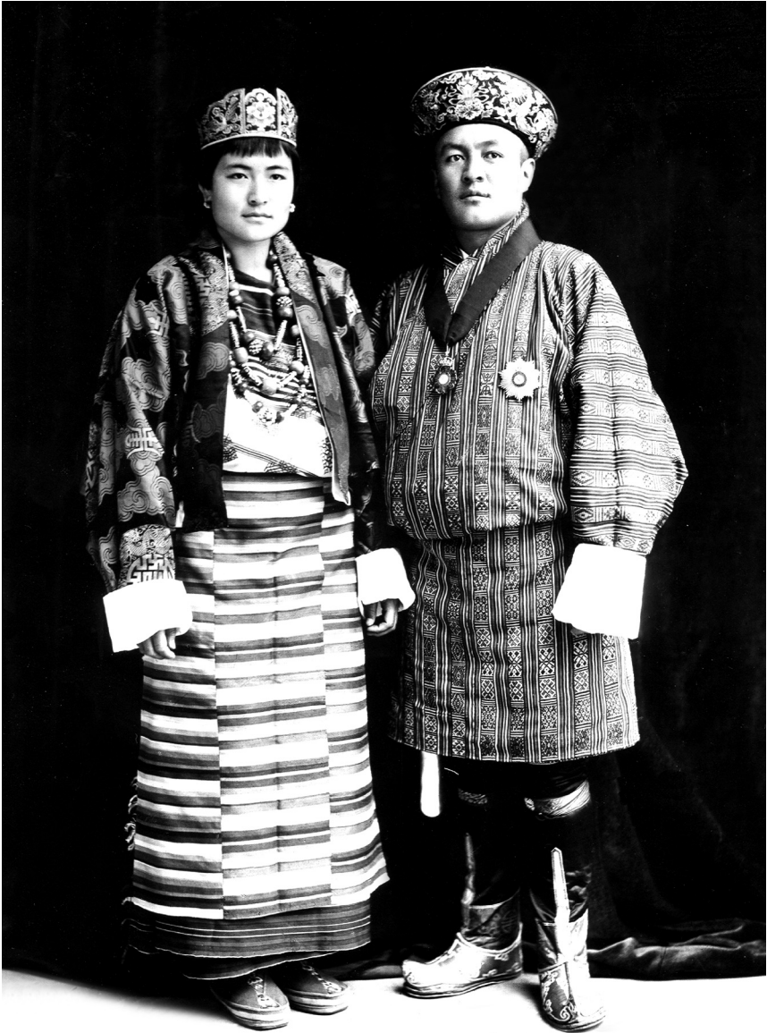
མི་དབང་འཇིགས་མེད་དབང་ལུག་མཚོག་དང་ རྒྱལ་ལུ་ལུ་ལུ་ཚོགས་ཚོས་རྒྱན་རྩམ་གཉིས་ སྤྱི་ལོ་ ༡༩༣༥ ལེ་ལོར་རྒྱ་གར་ལུ་གཞུང་དོན་གཞིགས་སྐོར་བྱོན་པའི་སྐབས།