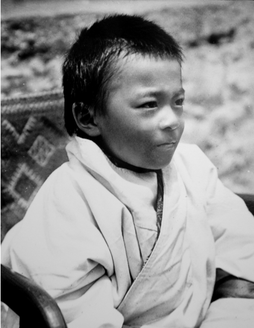
རྒྱལ་སྐད་འཇིགས་མེད་ལོ་རྒྱུན་དབང་ལྷུག་མཚོག་སྐུ་འབྲུངས་ཏེ་དགུང་ལོ་ལྔ་བཞེས་པའི་ སྐབས། པར་བཏབ་མི་ རི་བྱེད་མ་ རྩི་ལོ་ ༡༩༣༣ ལ་གནས་ ལུས་ཐང་།