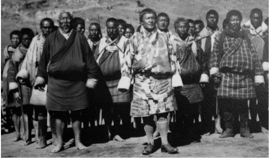
མི་དབང་འཇིགས་མེད་དབང་ལྷུག་མཚོག་ ཟ෍ལོ་༡༩༣༧ འི་ལོར་ བོད་ཀྱི་ཤ་གཞུང་གིས་མཐོན་བཅུ་འབདམ་བཞིན་དུ་ རྒྱ་གར་གྱི་རྒྱལ་ས་ཀྲོལ་ཀུ་ཧ་ལུ་གཞུང་དོན་གཞིགས་བསྐོར་གྱི་དོན་ལུ་ཕེབས་ཏེ་ ལོག་འབྲུག་ལུ་བྱོན་པའི་སྐབས།