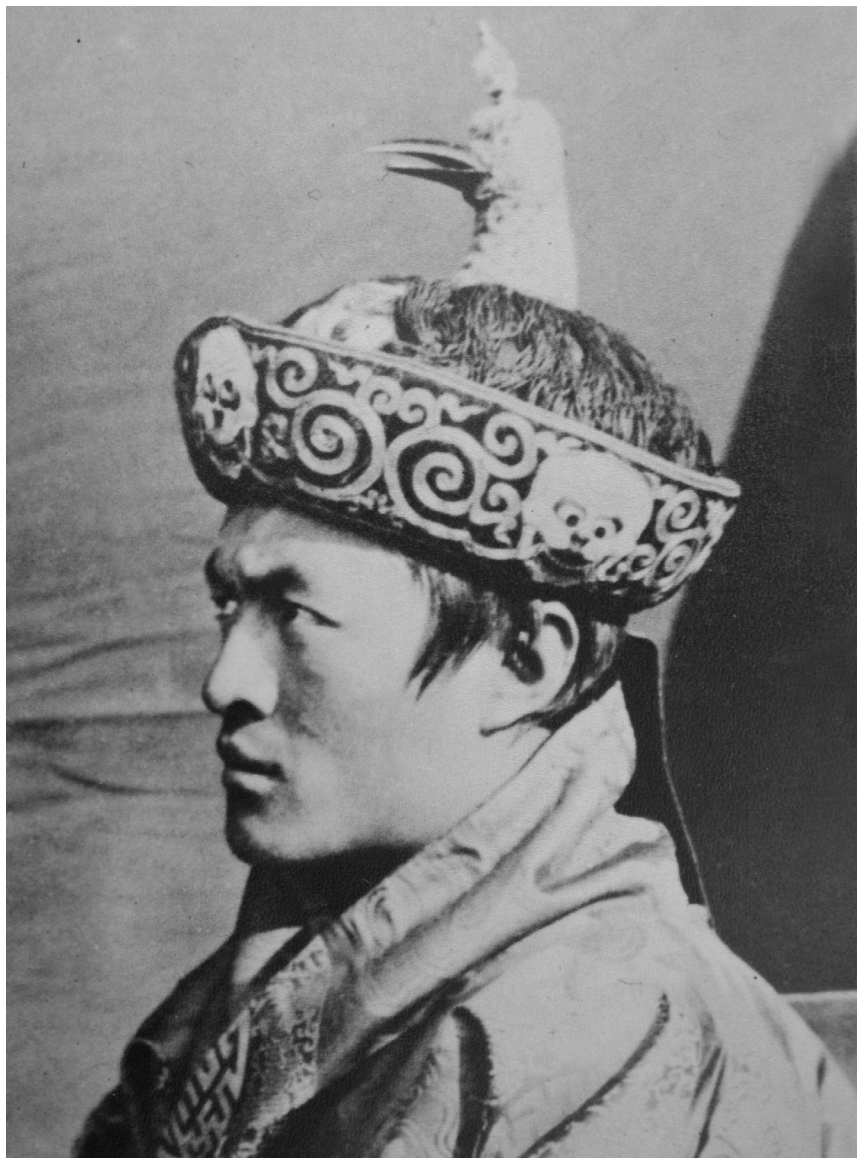
མི་དབང་འཇིགས་མེད་དབང་ལྷུག་མཚོག་ ལྷུ་ལོ་ ༡༩༣༣ ཟླ་ ༧ པའི་ཚེས་ ༢༦ ལུ་ དབུ་ལྷ་བྱ་རོག་གཏོང་ཅན་བཞེས་གནང་བ། པར་བཏབ་མི་ རྫོ་ཤུ་རིམ།