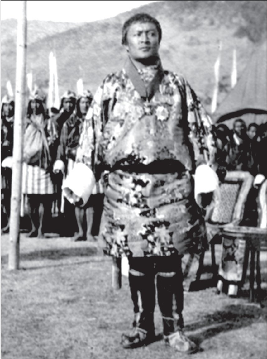
མི་དབང་འཇིགས་མེད་དབང་ལྷུག་མཚོག་ལུ་ དབྱིན་གཞུང་གིས་ཕྱུལ་བའི་ གཞེང་རྫོང་ ཀྱི་རྟགས་མ་བཞེས་གནང་བ།